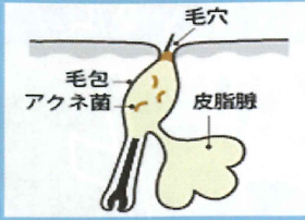
マイクロコメド 微小面ぼう